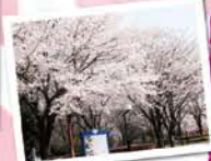
阿見町総合運動公園