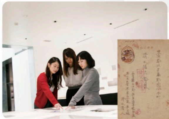
「検閲済」ハンコが押されたはがき

予科練平和記念館は、7つのテーマエリアで構成されています。まずは、予科練生を模したガラスケースが立ち並ぶ「入隊」と「訓練」のエリアへ。試験を突破して阿見町の予科練の門をくぐった少年たちは、朝早くから夜寝るまで、訓練に明け暮れていたそうです。彼らがどのような生活を送っていたのか、兵舎や教室を再現した展示室を見学します。