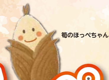
筍のほっぺちゃん