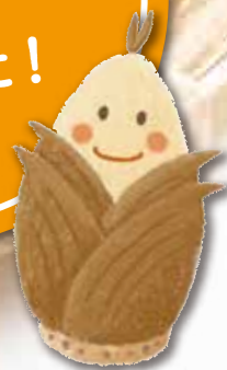
筍のほっぺちゃん